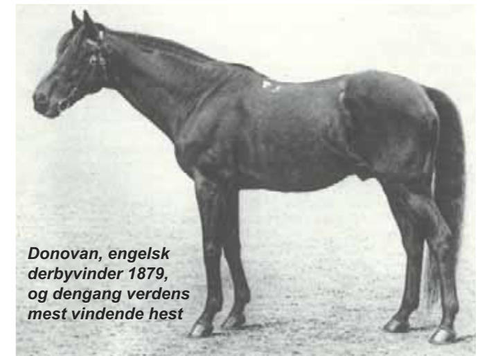
Donovan, engelsk derbyvinder 1879, og dengang verdens mest vindende hest