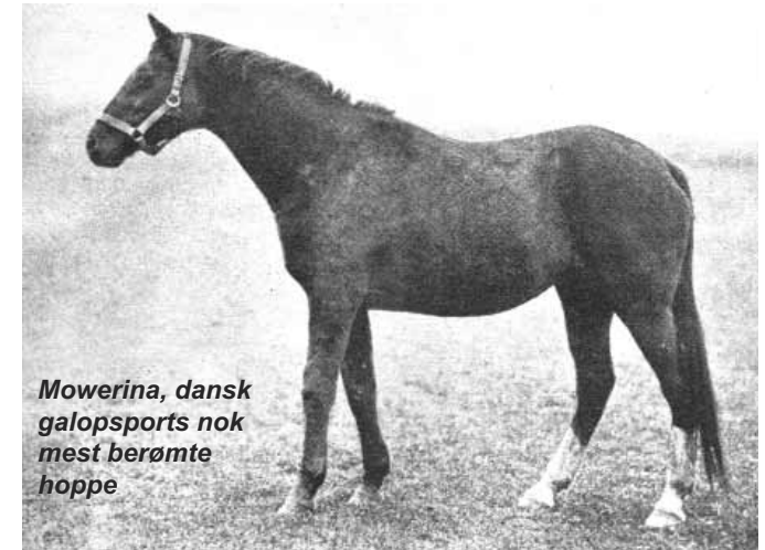
Mowerina, dansk galopsports nok mest berømte hoppe